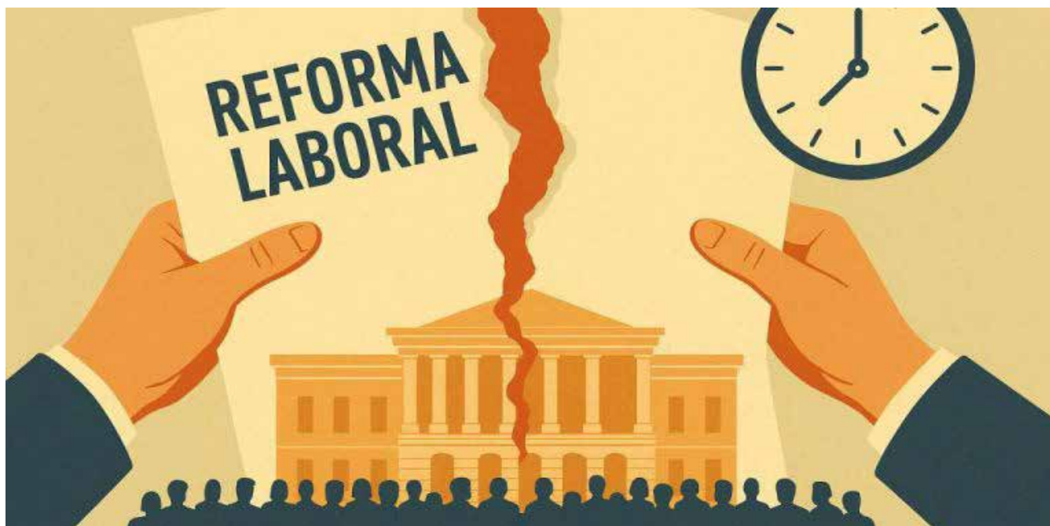
La contra reforma laboral de la oposición

La oposición aprobando una «reforma laboral» de acuerdo con los grandes empresarios, quisieron hacer «conejo» a Colombia. Los colombianos afectados por el «engendro» de «reforma laboral», se lanzan a las calles a reclamar la Consulta Popular.