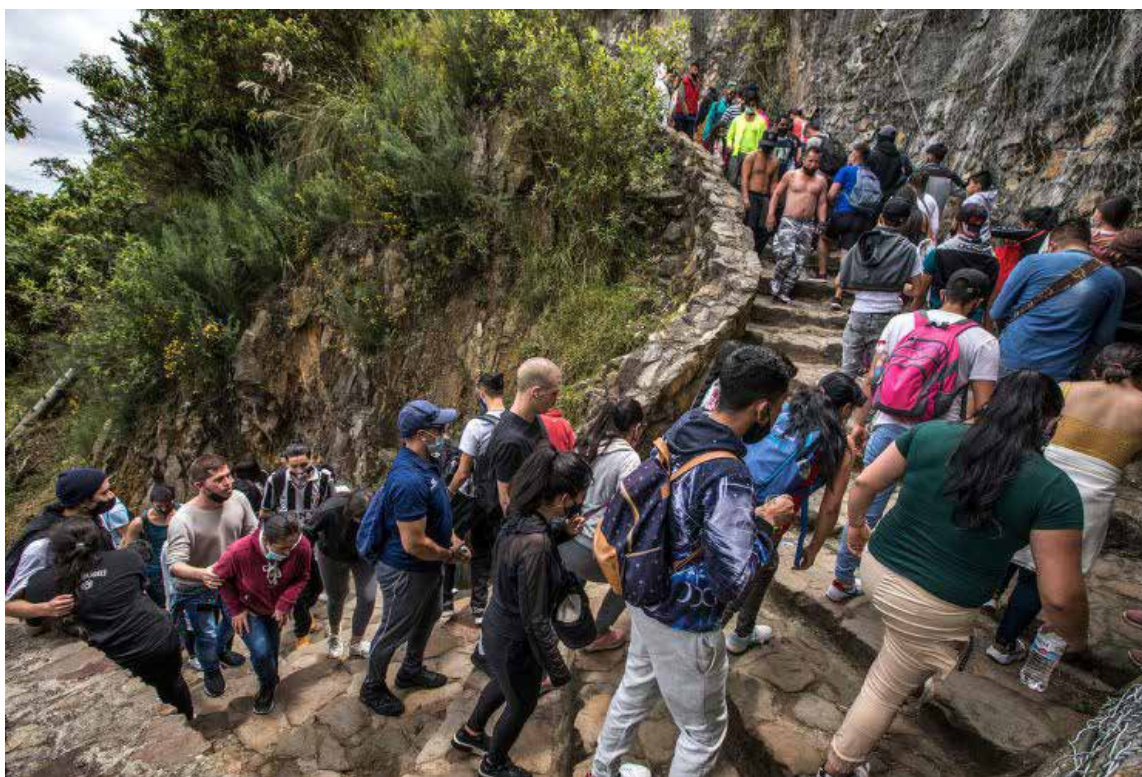
Cada domingo, Monserrate atrae a multitudes de bogotanos que buscan una dosis de ejercicio o un agradable paseo. Es, por excelencia, el punto de encuentro y recreación más concurrido de la capital.