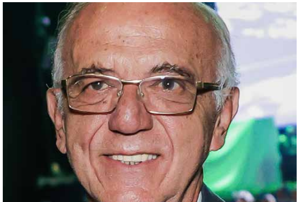
Iván Velásquez Gómez, embajador de Colombia ante la Santa Sede