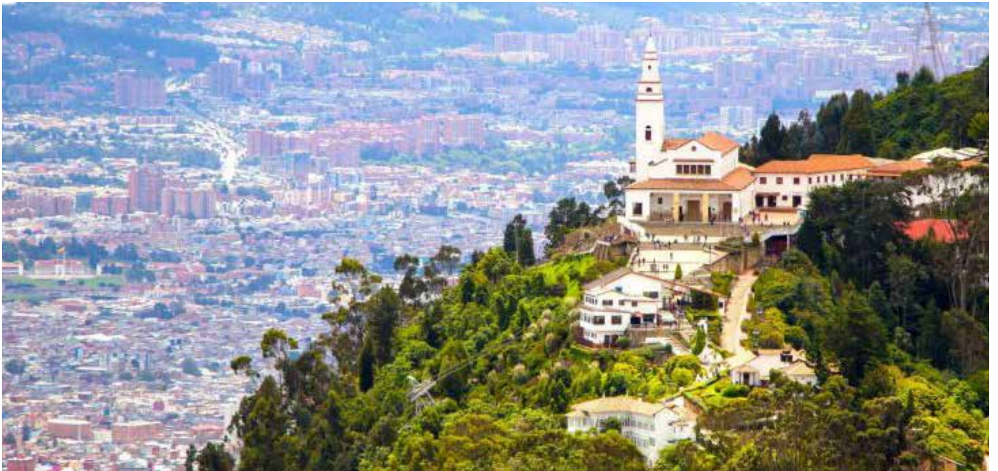
La majestuosa montaña que custodia Bogotá, coronada por su emblemático templo