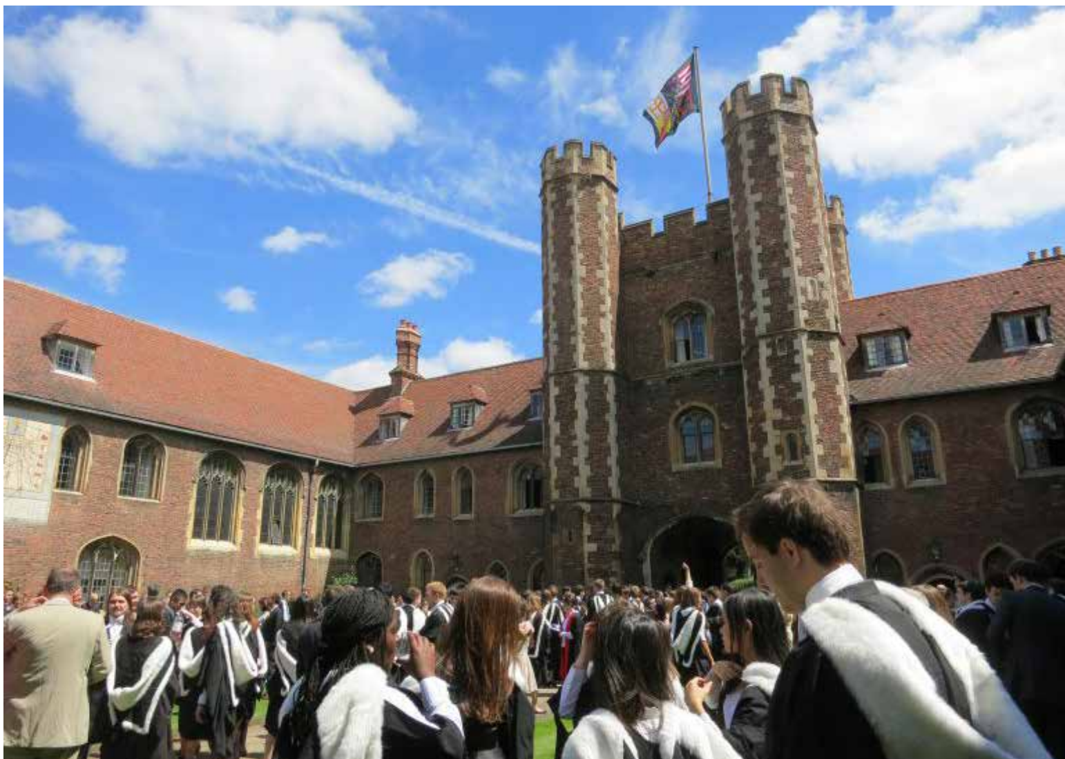
Universidad de Cambridge

Carlos I terminó derrotado; sus hombres encogidos como caracoles, asustados como gatos. El rey fue arrestado sin ningún privilegio. Nadie tuvo en cuenta que era el timonel de la isla más poderosa de Europa por derecho y por ley, pues había heredado el trono inglés de su padre -Jacobo I- como ordenaba el protocolo. Pero igual no importó. Terminó ejecutado como un simple ciudadano de Europa sin sus riquezas personales y sin los títulos que le pertenecían como miembro de la realeza.