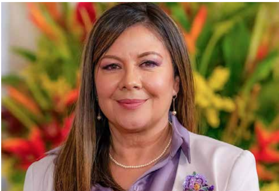
Luz Adriana Camargo Garzón, Fiscal General de Colombia

La reciente orden de captura emitida en Guatemala contra la Fiscal General de Colombia, Luz Adriana Camargo Garzón, y el embajador colombiano ante la Santa Sede, Iván Velásquez Gómez, ha generado un agudo contraste. Ambos funcionarios, ampliamente reconocidos por su férrea trayectoria en el combate a la corrupción tanto en Colombia como a nivel internacional, son ahora objeto de persecución por un sistema judicial guatemalteco permeado por la corrupción