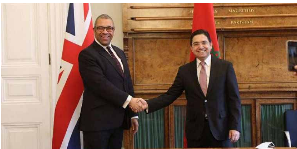
El Reino Unido anuncia oficialmente su apoyo a la propuesta de autonomía para el Sáhara marroquí

E l Reino Unido ha oficializado su apoyo a la propuesta de autonomía presentada por Marruecos en 2007 para la región del Sáhara Occidental. En un comunicado conjunto firmado este domingo en Rabat por el ministro británico de Asuntos Exteriores, David Lammy, y su homólogo marroquí, Nasser Bourita, Londres calificó la iniciativa como «la base más creíble, viable y pragmática para un arreglo duradero del contencioso». Esta declaración, recogida por la agencia de noticias MAP, marca un cambio significativo en la política exterior británica y alinea al