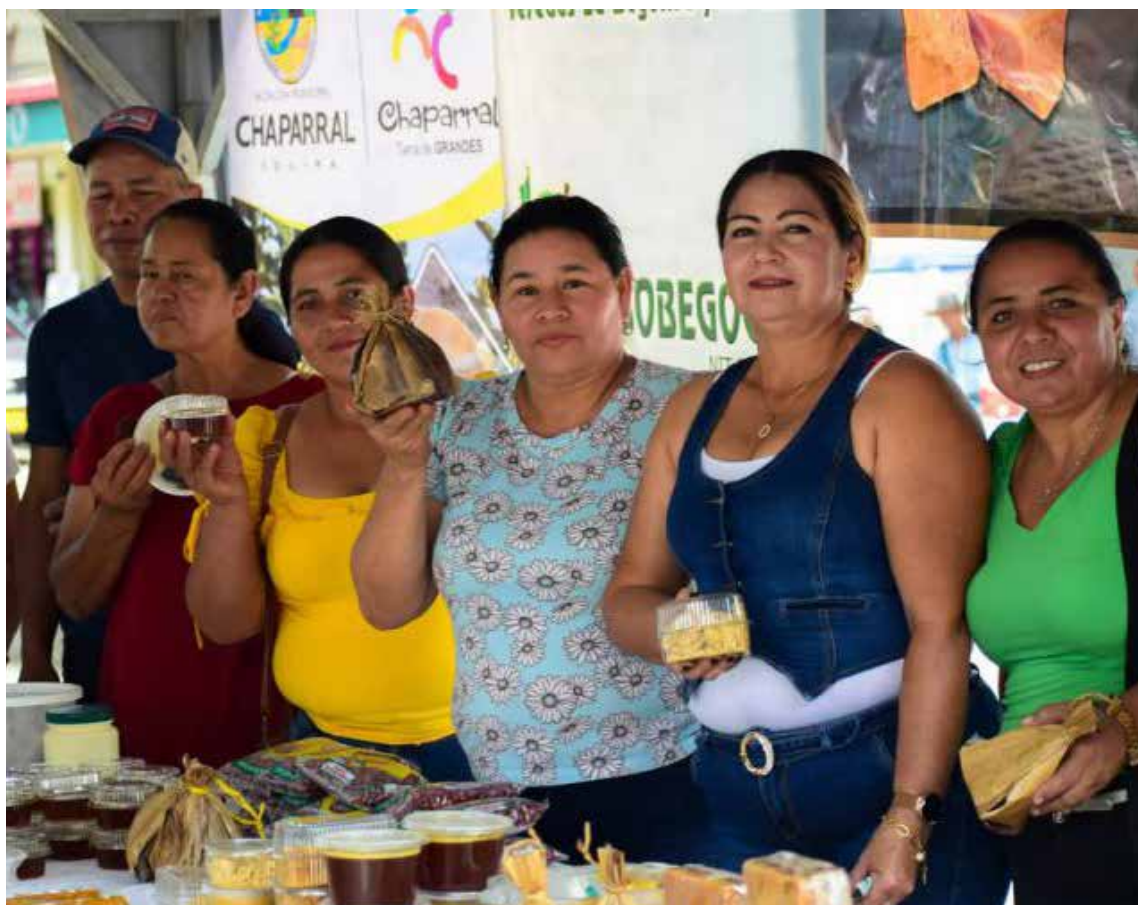
«Café, Chocolate y Panela al Parque», una feria que no solo celebra los sabores auténticos de la región, sino que también rinde homenaje a la incansable labor de los campesinos del sur del Tolima.

«El Ejército Nacional tiene como función primordial acompañar a las comunidades rurales en sus procesos de desarrollo. Apoyar estos espacios no