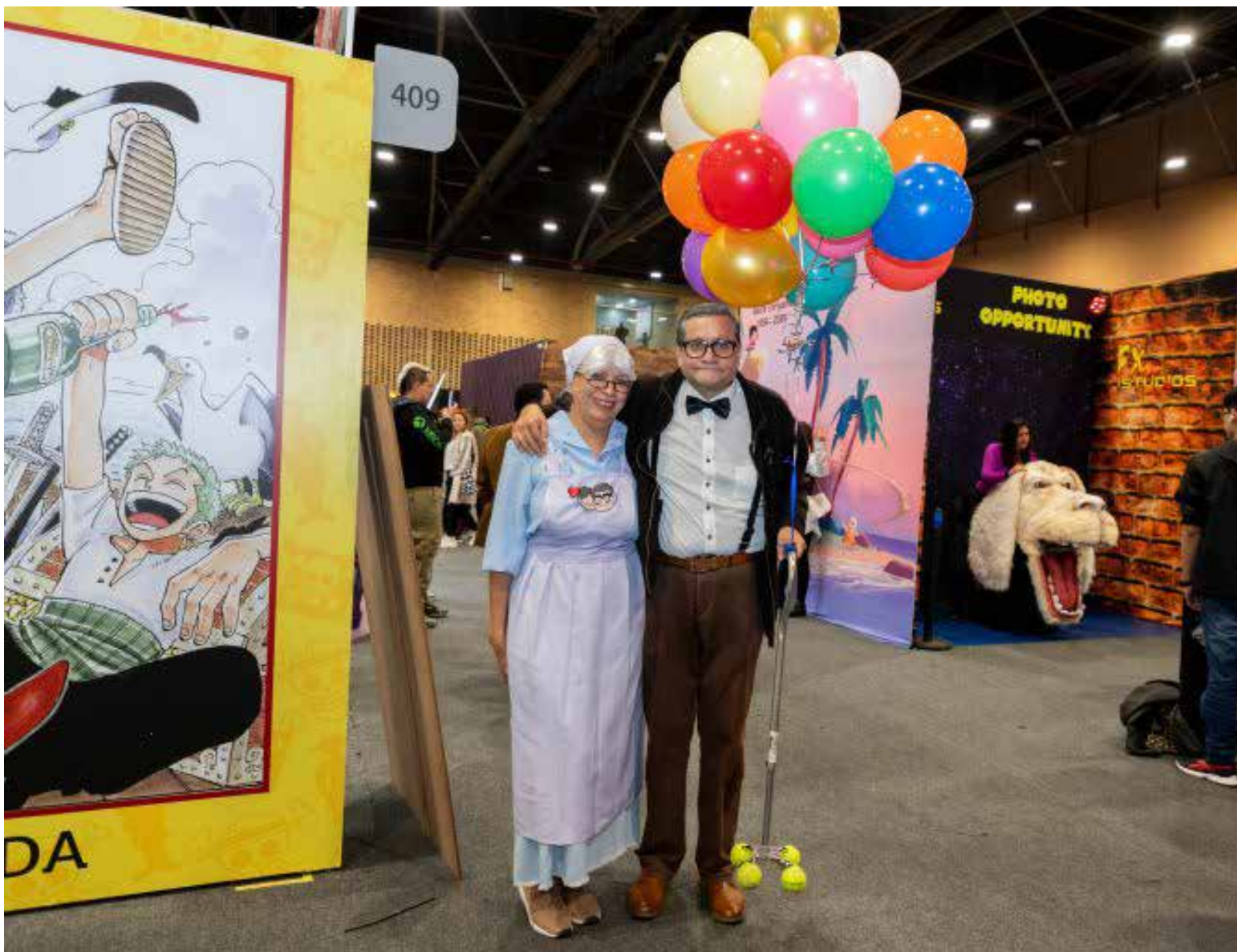
Sexta edición de Comic Con Colombia, el evento geek más importante del país, del 27 al 30 de junio en Bogotá.

Comic Con Colombia contará con la presencia de ocho invitados internacionales, incluyendo actores de Hollywood como Drake Bell y Christopher Mintz-Passe, además de reconocidos actores de doblaje y la cantautora japonesa Mika Kobayashi. También participarán cosplayers profesionales de renombre internacional, como Yaya Han y Taryn Cosplay.