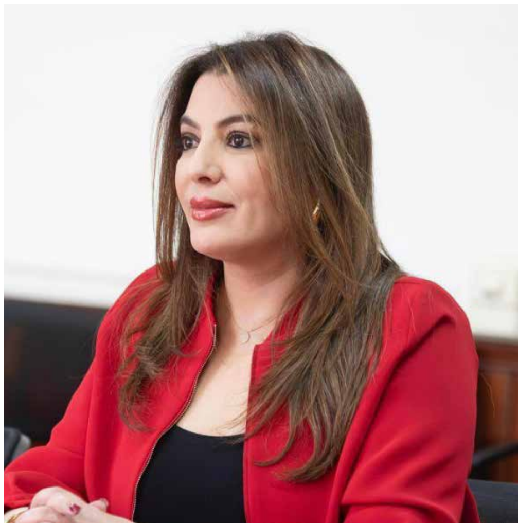
La Embajadora del Reino de Marruecos en Colombia y Ecuador, Farida Loudaya

La ampliación de este consenso, concluyó la Embajadora, «constituye una oportunidad histórica para resolver definitivamente este prolongado diferendo y avanzar hacia una región del Magreb unida, estable e integrada».