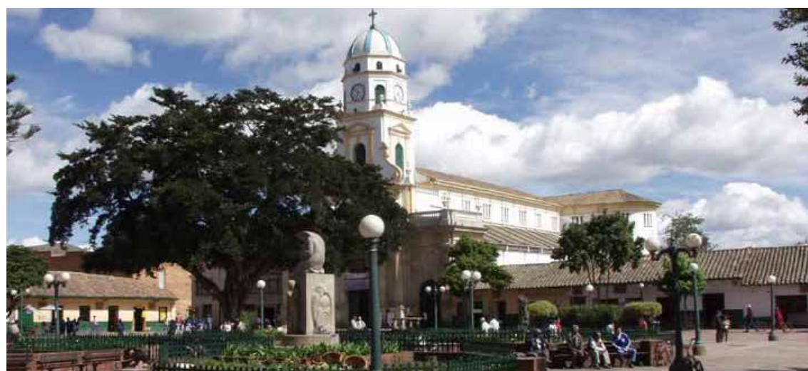
Plaza principal de Chía