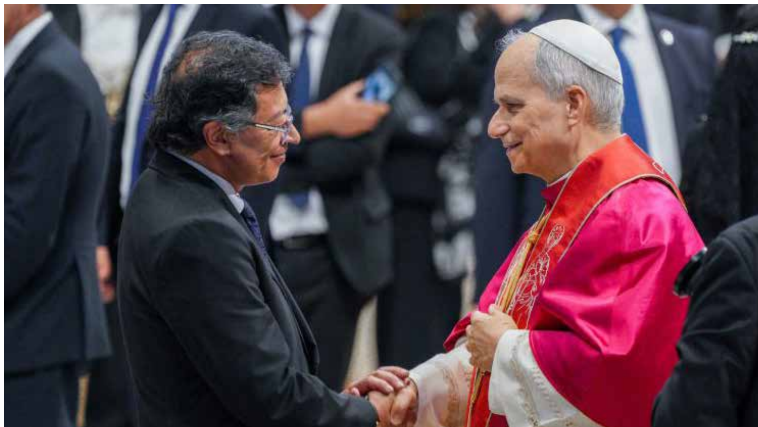
Diálogos de Paz de Colombia pueden hacerse en El Vaticano.

No se trata de una única «desaparición», sino de un patrón. Agosto de 2023 fue un hito, cuando Petro, durante la Cumbre Amazónica en Brasil, no asistió a citas clave. La Casa de Nariño argumentó «asuntos urgentes» o «mal tiempo», pero las dudas persistieron por unas 24 horas. El ex canciller Álvaro Leyva ha alimentado la hoguera, mencionando ausencias en París o Davos, aunque el presidente siempre ha desmentido, alegando «agenda privada» o visitas culturales. Más recientemente, a finales de mayo de 2025, una ausencia de casi 48 horas, sin participación en la Cumbre de Jefes de Estado y Gobierno de