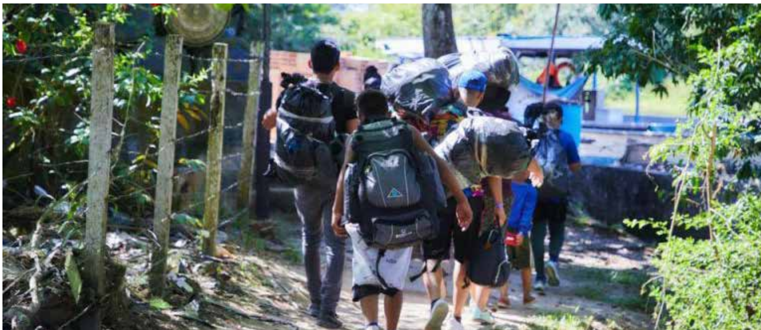
Esta «migración a la inversa» por el océano Pacífico, si bien no es un fenómeno masivo organizado como una devolución orquestada desde EE. UU., constituye una grave violación de derechos fundamentales.

Mientras las rutas irregulares por el Pacífico para llegar a Norteamérica son bien conocidas y están dominadas por el tráfico de personas, la identificación de este flujo de retorno añade una capa de urgencia. La Defensoría del Pueblo de Colombia, tras una reciente incursión en la frontera con Panamá (en seguimiento a una Alerta Temprana Binacional), confirmó que la migración inversa no solo ocurre por el Caribe, sino también por el Pacífico, específicamente desde el corregimiento Jaqué en el Darién panameño hacia Buenaventura (Valle del Cauca) y, de forma más alarmante, hacia Juradó y Ciudad