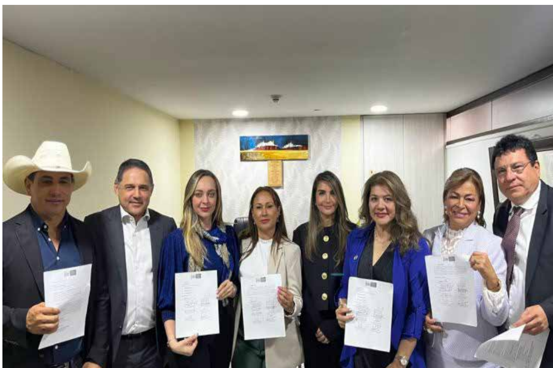
Los miembros de la oposición la Comisión Séptima del Senado impidieron que la iniciativa fuera debatida, lo que finalmente llevó a su hundimiento. Esta acción subraya la marcada polarización política y las dificultades del gobierno para avanzar su agenda legislativa en el Congreso.

E n Colombia, la reforma laboral ha desatado un conflicto latente entre el Gobierno y sectores del Congreso. La versión del proyecto que ha avanzado en la Comisión Séptima del Senado, impulsada por figuras como el presidente del Congreso, Efraín Cepeda, es calificada por el presidente Gustavo Petro como una «verdadera contrarreforma». Petro argumenta que esta propuesta representa un retroceso significativo para los trabajadores, especialmente por la inclusión del trabajo por horas, que considera más precario que los contratos temporales y la Ley 50, al impedir ingresos de subsistencia dignos. Aunque la versión aprobada en tercer debate (13 votos a favor, 2 en contra) inclu-