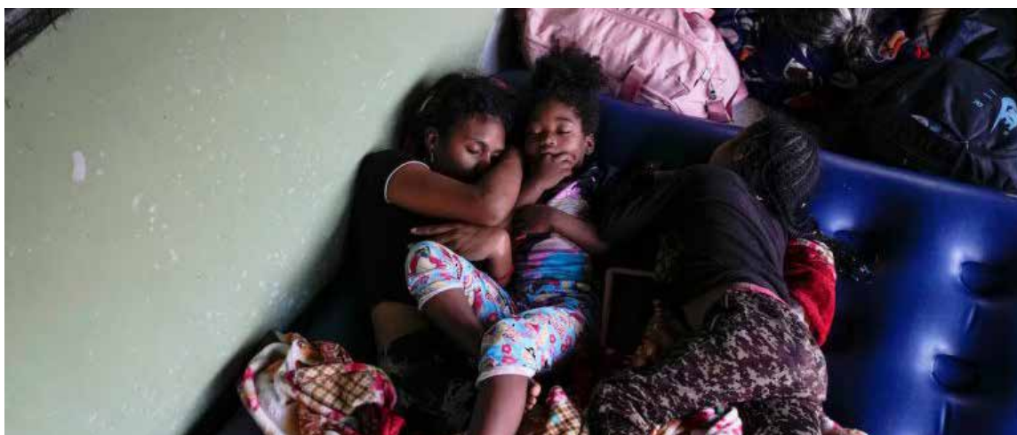
La Defensoría del Pueblo de Colombia, tras una reciente incursión en la frontera con Panamá (en seguimiento a una Alerta Temprana Binacional), confirmó que la migración inversa no solo ocurre por el Caribe, sino también por el Pacífico