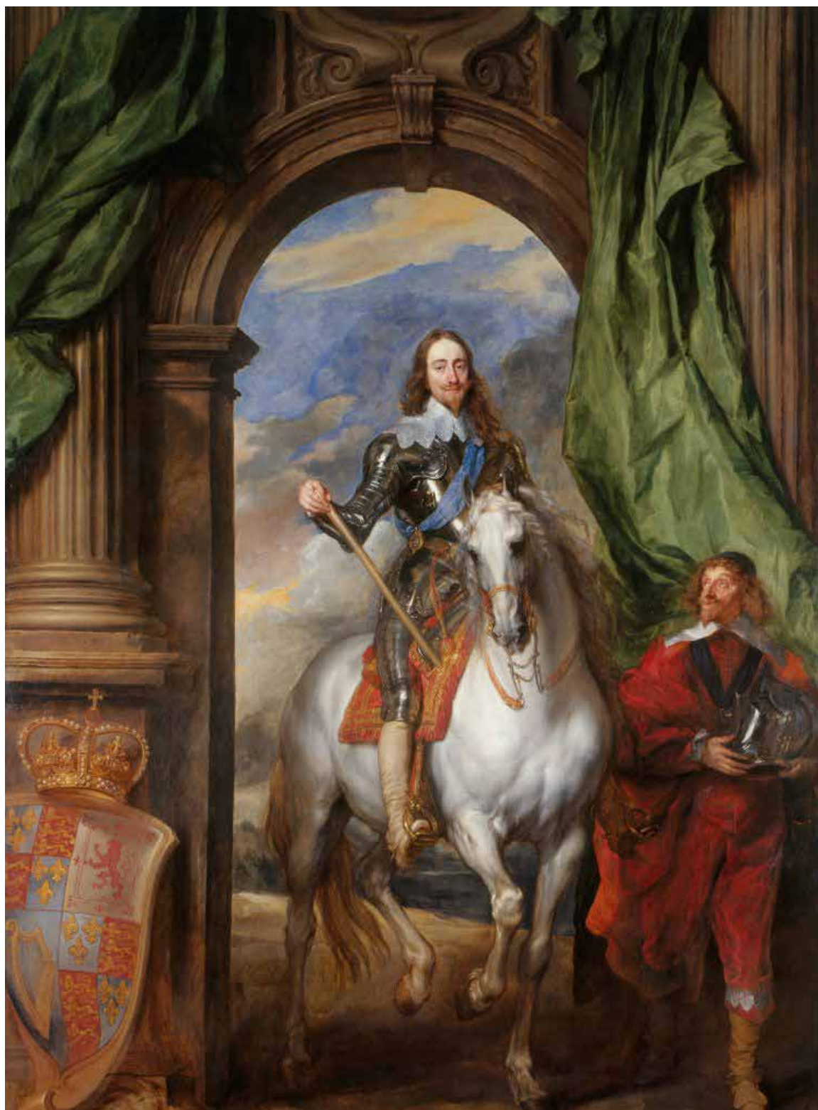
El Rey Carlos I de Inglaterra

Los miembros del Parlamento inglés comenzaron a elevar su tono contra el Rey Carlos I. A gritos le discutían temas de economía, de religión, sobre la forma adecuada de distribuir el poder político. No querían a un Carlos I voluntarioso y de corte absolutista -como