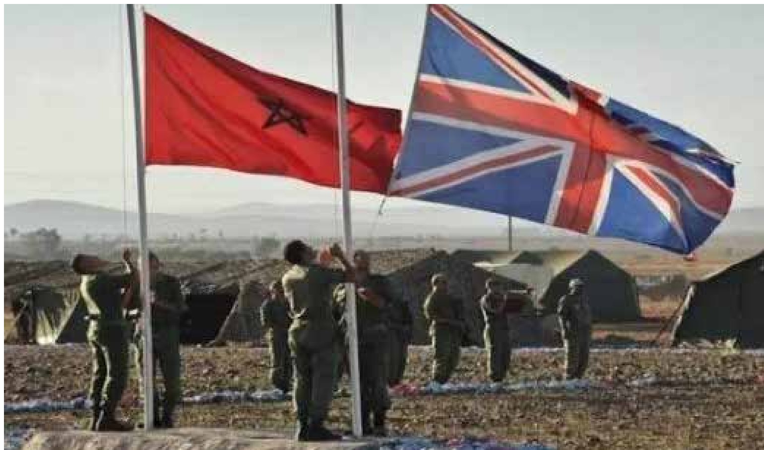
Reconocimiento informal de la soberanía marroquí sobre su Sáhara, así como a una aquiescencia clara a la administración efectiva de Marruecos sobre la región.

Agencias de Noticias Rue20 Español/EI Aaiún Rabat, Marruecos