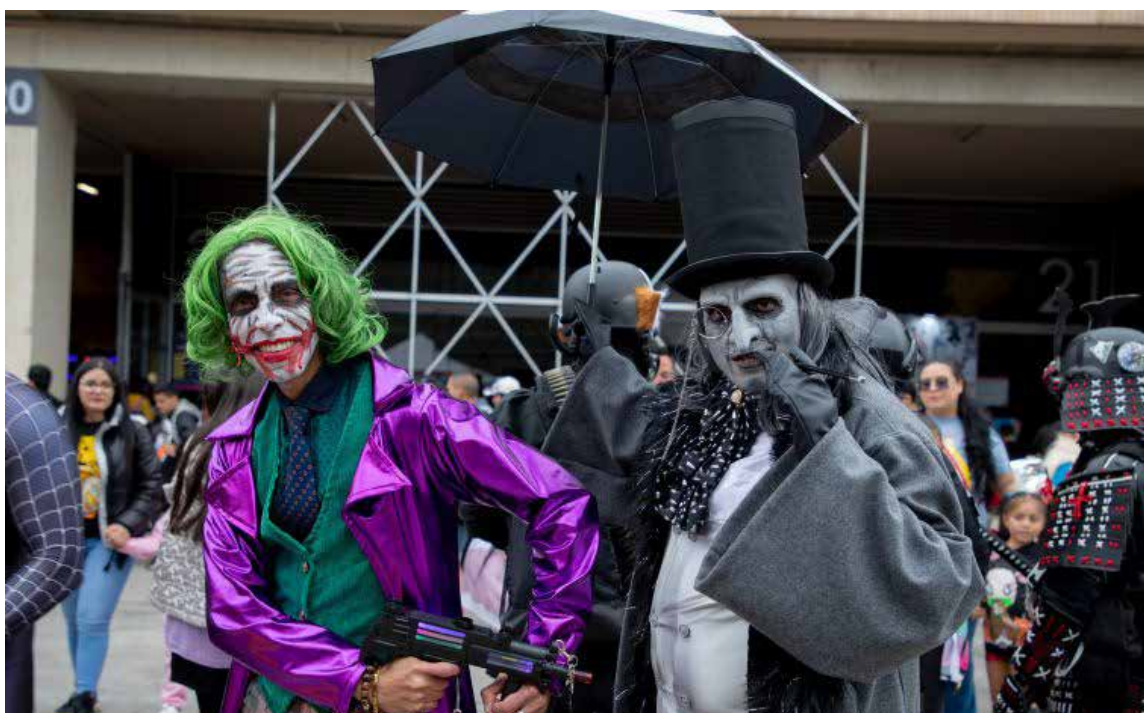
Un espacio destacado para que 80 artistas, entre ilustradores y escultores, presenten sus obras directamente al público.

Los amantes del cosplay podrán disfrutar de la tradicional Copa Cosplay y la Boda Cosplay, mientras que el Artist Alley ofrecerá un espacio destacado para que 80 artistas, entre ilustradores y escultores, presenten sus obras directamente al público.